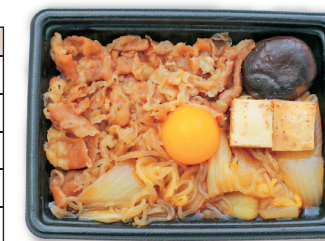
写真は牛すき焼き重です