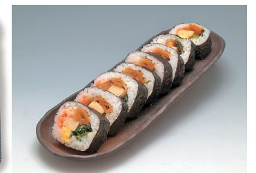
写真は巻寿司です

トレーサイズ(丼): 13×18×4cm トレーサイズ(すし): 11×27×4cm カロリー / 1食: 525~690kcal 塩分 / 1食: 1.3~3.9g