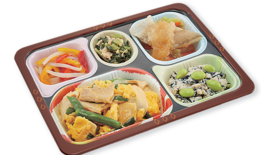
写真は「豚ニラ玉/鰯のおろしポン酢/ひじきと枝豆の白和え/ もやしとパプリカ中華サラダ/葉大根のツナ和え」です。 (写真上は盛付イメージです。)

トレーサイズ: 16.4×21.8×2.7cm カロリー / 1食: 201~267kcal 塩分 / 1食: 1.5~2.2g