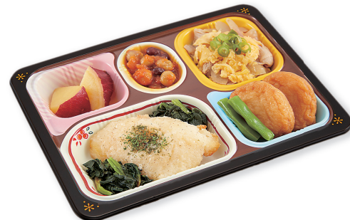
写真は「鰯(カレイ)のムニエル/柳川煮/薩摩揚げの煮物/ 薩摩芋のオレンジ煮/豆のトマト煮」です。 (写真上は盛付イメージです。)

トレーサイズ: 16.4×21.8×2.7cm カロリー / 1食: 161~356kcal 塩分 / 1食: 1.4~2.0g