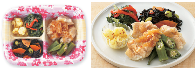
写真は「鶏肉の甘辛たまねぎあんかけ/おくらのおひたし/ほうれん草のソテー/ カリフラワーのマスタード和え/ひじきの煮物」です。(写真右は盛付イメージです。)

トレーサイズ: 15×23×5cm カロリー / 1食: 212~258kcal 塩分 / 1食: 1.5~1.9g