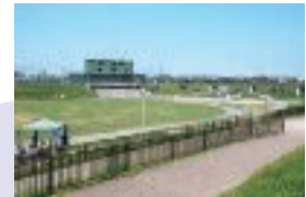
花園多目的遊水地の平常時

遊水地・治水緑地は、河川の水位が上がったときに雨水を一時的に貯留することで下流河川の負担を軽減させ、水位の上昇を抑えるための施設です。平時は、都市の貴重なオープンスペースとして公園などに利用されています。