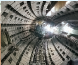
整備中の新岸田堂幹線