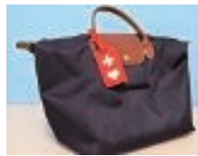
ヘルプマークはカバンなど、目立つ所につけましょう。