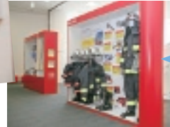
各種展示コーナー