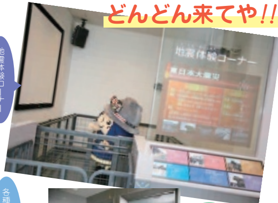
地震体験コーナー