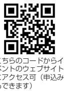
こちらのコードからイベントのウェブサイトにアクセス可(申込みもできます)

市内のモノづくり企業の若手社員などと交流し、市内企業の魅力を見逃しませんか。ラグジュアリーな結婚式場で、東大阪が誇るモノづくり企業の話を聞くことのできる就活イベント「就活スタート会場イベント カフェトーク」を開催します。若手社員との「ふっちゃんパネルドイ」を2月15日(火)21日(火)に、エトールで。当日、2つ以上のセミナーに参加した方限定50人に「ふっちゃんパネルドイ」をプレゼントします。