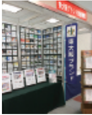
認定製品のPRを行います

認定された製品は、東大阪ブランドのシンボルマーク(画像)の使用や各種展示会への出展、東大阪ブランド推進機構ウェブサイトでのPR活動ができるようになります。▽最終製品であること▽市内に本社およびその実態があること、もしくは製品の主要部分を市内の工場で製造していること▽3つの認定基準▽オンリーワン▽全国で唯一自社のみが製造していること▽認められた製品▽ナンの市場▽特定の市場で販売数量や販売額がトップシェアを記録していること