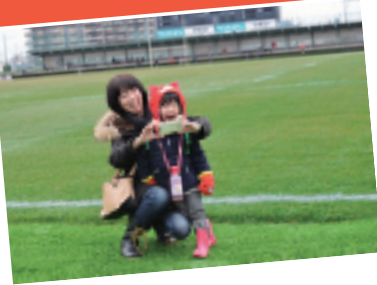
サイン入りラグビーグッズが当たる抽選会がトップリーグ選手会の協力で行われました