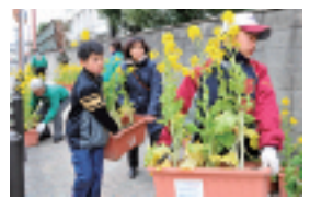
この「菜の花忌」は、司馬遼太郎さんが野に咲く菜の花が好きだったこと、作品の中に「菜の花の沖」という小説があることに由来しています。またこの運動は、記念館が開館してから14年もの間続けられていました。

28日は、記念館内に菜の花のプランター約240個とたくさん切った花が飾られました。今年、菜の花は例年より早咲きで、2月中旬に見頃を迎えそうです。