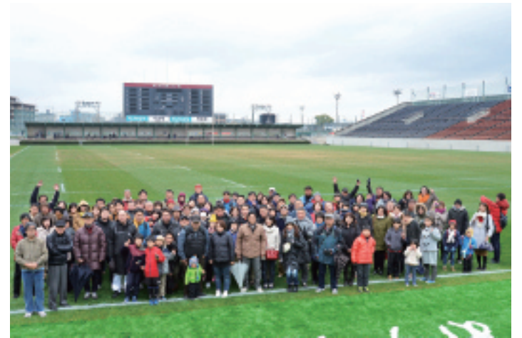
午後の部の参加者全員で撮った記念写真(上) サプライズで行われた抽選会でサイン入りジャージが当たり、記念撮影をする親子(右)