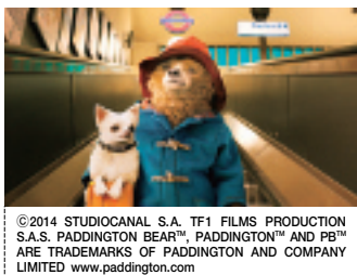
©2014 STUDIOCANAL S.A. TF1 FILMS PRODUCTION S.A.S. PADDINGTON BEAR™, PADDINGTON™ AND PB™ ARE TRADEMARKS OF PADDINGTON AND COMPANY LIMITED www.paddington.com