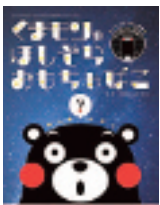
©2010 kumamoto pref. kumamon#K10819 熊本県P日キャラクター「くまモン」制作・著作 © TAIYO KIKAKU co.,ltd. / EXPJLtd

熊本地震支援企画「くまモンのほしぞら☆おもちゃばこ」(写真)と「楽しい星座探し」を投影中です。 ※詳しくはドリーム21ウェブサイトをご覧ください。