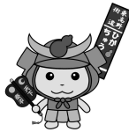
ひょうたん山夢街道まっつりマスコットキャラクタークッキー「ひがちゅう」

時 7月31日(日)14時～16時(開場は13時30分) 所 やまなみプラザ(四条) 定 80人(当日先着順) 内 基調講演「信仰とまちの歴史」、パネルディスカッション「古い路 東高野街道」 時 7月31日(日)14時～16時(開場は13時30分) 所 やまなみプラザ(四条) 定 80人(当日先着順) 内 基調講演「信仰とまちの歴史」、パネルディスカッション「古い路 東高野街道」 時 7月31日(日)14時～16時(開場は13時30分) 所 やまなみプラザ(四条) 定 80人(当日先着順) 内 基調講演「信仰とまちの歴史」、パネルディスカッション「古い路 東高野街道」