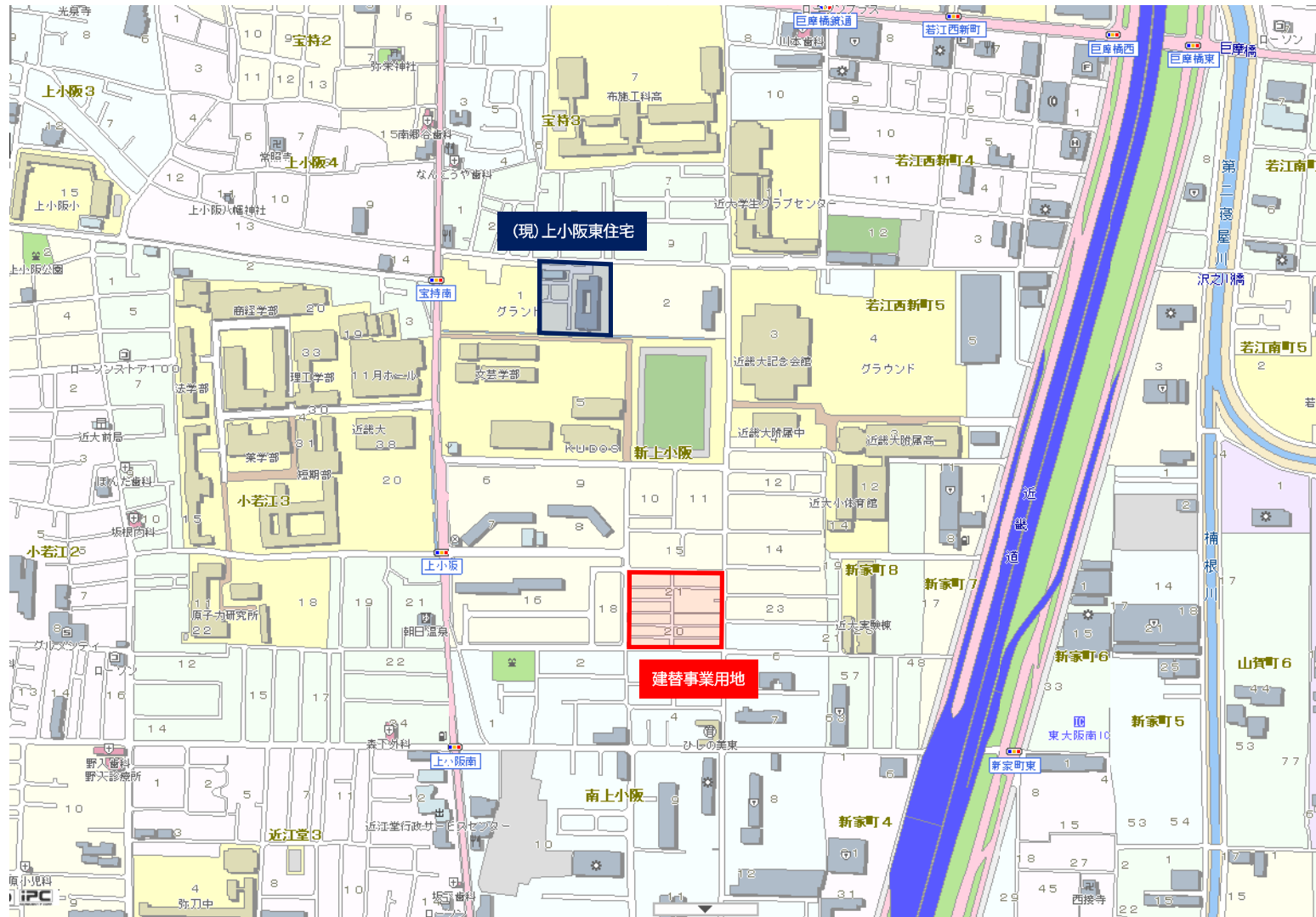
■建替事業用地及び(現)上小阪東住宅位置図