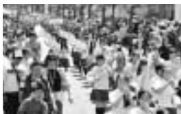
前回のふれあい祭り

来年5月に開催する市民ふれあい祭りの出店および出演者を募集します。参加希望者は必ず説明会に出席してください。