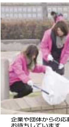
企業や団体からの応募もお待ちしております

全国高校ラグビー大会の開催日に、花園中央公園内で美化活動などを行うボランティアサポーターを募集します。応募については、個人、団体を問いませんが、当日や交通送(ファクス、Eメール、直接も可) ※申込用紙は、市ウェブサイトからダウンロード可。