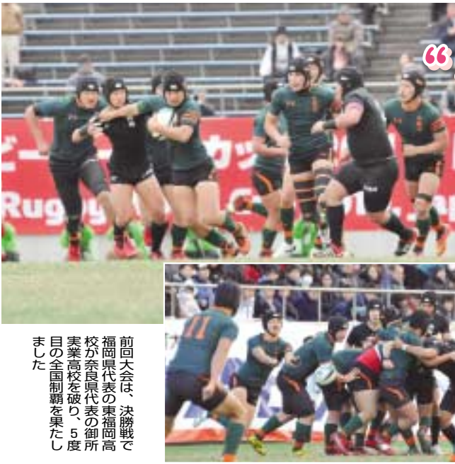
前回は、決勝戦で福岡県代表の東福岡高校が奈良県代表の御所実業高校を破り、5度目の全国制覇を果たしました。

この大会から4年後のラグビーワールドカップ2019日本大会で活躍する選手が誕生するかもしれません。ぜひ、市花園ラグビー場へお越しください。