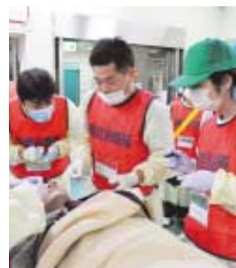
真剣な表情で患者役の男性の容態を確認する医師

大規模災害を想定した患者の受入れ合同訓練が11月10日、市立総合病院と府立中河内救命救急センターで行われ、いざというときにとるべき行動を確認しました。この訓練は、災害拠点病院に指定され、隣接している両病院が、