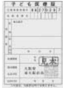
新しい子ども医療証(びわ色)がまだ届いていない場合は、医療助成課までお問い合わせください。

子ども医療証(びわ色)を12月中旬に送付しました。古い医療証は使用することができませんので、医療助成課または行政サービスセンターに返却していただきます。