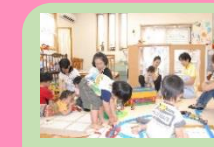
親子でほんわか交流