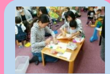
親子でカレンダー作り