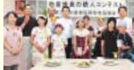
昨年は3チームが決勝大会で自慢の料理を競いました

東大阪市産の農産物を使い、1品当たりの野菜の使用割合や地産地消を意識したオリジナル料理コンテストの出場者を募集します。優勝者のレシピは市内フランス料理