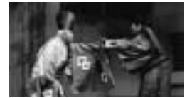
大間川のワンシーン

人間国宝の野村萬さんをはじめ、東西の名だたる狂言師による伝統芸能をお楽しみください。 11月7日(金) 18時～20時30分 市民会館市民ホール ※駐車場はありません。 1,500人(市内在住・在勤・在学を優先して抽選) 「大間川」=野村萬さん、野村万蔵さん、小笠原匡さん 「寝音曲」=茂山茂さん、茂山逸平さん 「悪太郎」=茂山千五郎さん、茂山七五三さん、網谷正美さん 狂言研究者の木村要さんによる狂言解説 基本事項(10面に掲載)