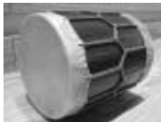
20 直径 16 . 5 cm x 高さ 16 cm の 梓 桶 太鼓