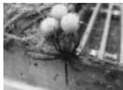
セアカゴケグモ(メス)と卵のう 特徴 体長約1cmで全体が黒く、背に赤い帯状の模様がある

セアカゴケグモは、本市全域で発見されていて排水溝の側面、庭石・墓石の間やくぼみ、屋外のブロック、プランターなどに生息しています。比較のおとなしいクモでむやみに危害を加えることはありませんが、万一の被害を防ぐた