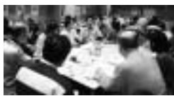
これまで5回の意見交換会には約1,650人の方が参加しています

なかをみんなで考え、共有・共感します。今回は、これまでの5回の意見交換会で話し合われた内容をテーマごとに発表し、参加者自らの投票により、今地域に必要な活動を決定します。これまで参加したことがない方も、議論の過程と地域の現状を知ることが出来ます。また住んでいる地域に限らず、誰でも興味がある地域の意見交換会に参加できます。