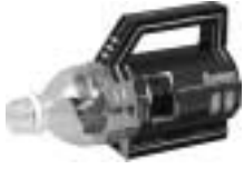
ペットボトルを使った組立キット

4月26日(土)13時～16時 市内在住の小学生 定30人(申込先着順) ペットボトル(500ml)、持ち帰り用袋 基本事項(下に掲載)と学校名・学年、保護者氏名を4月1日(火)～18日(金)(必着)にハガキで(電話、ファクス、Eメール、直接も可)