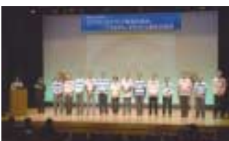
意見交換会などで活躍した地域サポート職員が想いを述べました