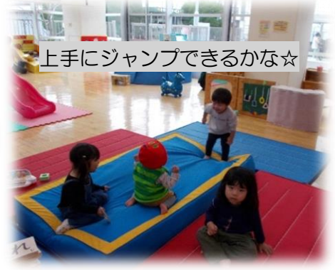
上手にジャンプできるかな☆