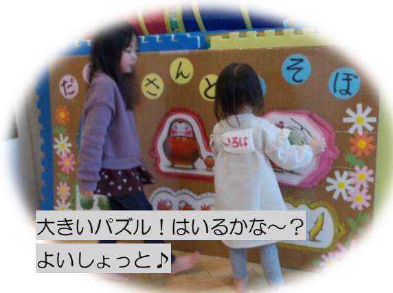
大きいパズル！はいるかな～？ よいしょっと♪