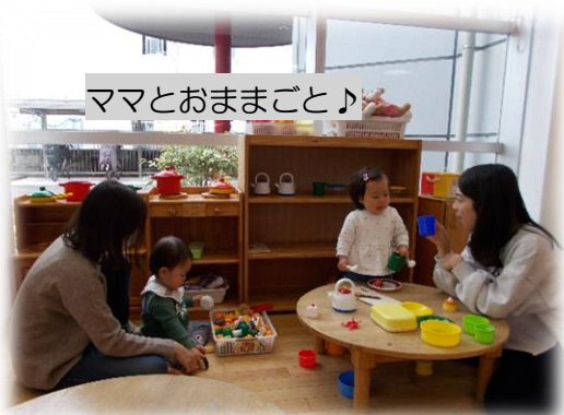
ママとおままごと♪