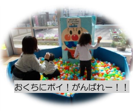
おくちにポイ！がんばれー！！