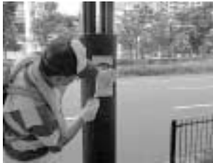
市内をパトロールして違法な屋外広告物を取り除きます

9月1日から10日までは、「屋外広告物美化旬間」です。市では、違法簡易屋外広告物追放推進団体「まち