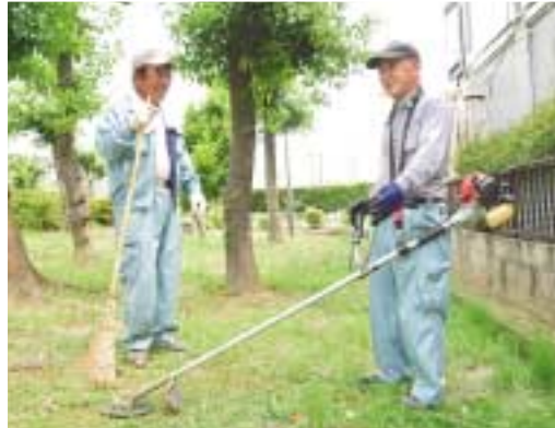
緩衝緑地公園(中新開)で除草作業(写真⑤)や受付事務(写真⑥)を行う会員の皆さん