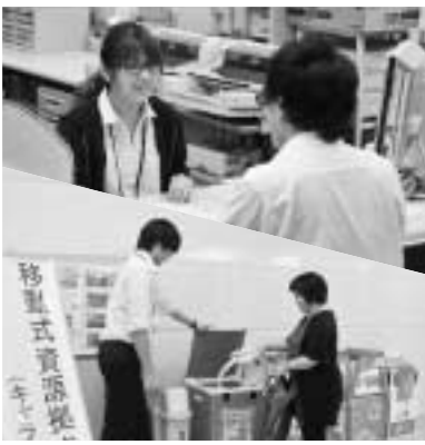
土曜開庁時の一部窓口や資源のキヤラバン回収をご利用ください。

【国民年金】 ▽問合せ先 国民年金課 06(4309)3165、06(4309)3805