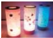
作製するLEDランタン

年齢(学年)、電話番号を書いて8月28日(木)消印有効)までに郵送 ■ところ・申込み・問合せ先 〒578-0924 吉田6-7-22 市民美術センター 072(964)1313、FAX072(964)1596