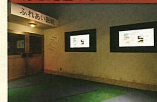
応急処置体験コーナー

いざというときに役立つ応急処置の方法を、映像とパネル、実際の練習などで学習します。