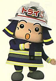
119番通報体験コーナー