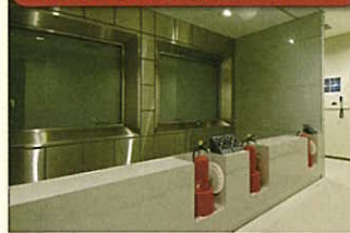
初期消火体験コーナー