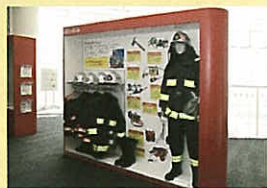
地域防災情報コーナー