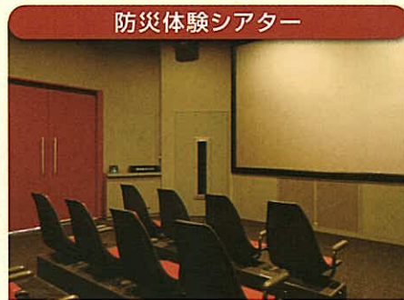
防災体験シアター