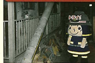
被災地体験コーナー