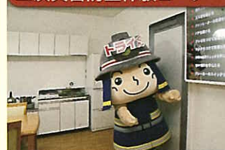
二次災害防止体験コーナー

地震が起こったとき、どのように行動するべきか、実際に行動し、確認しながら学習します。