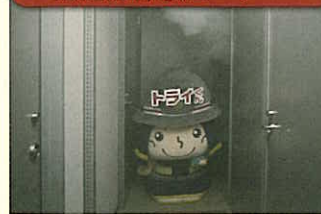
煙避難体験コーナー

地震が起こったとき、どのように行動するべきか、実際に行動し、確認しながら学習します。