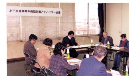
第1回アドバイザー会議