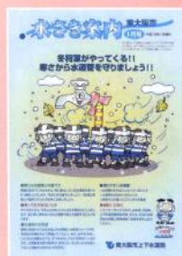
水さき案内 (広報誌)