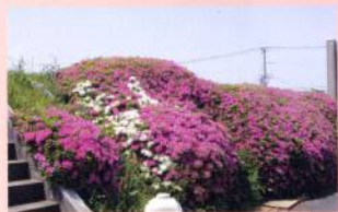
上小阪配水場 つつじの市民開放※