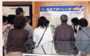
上下水道モニター施設見学会