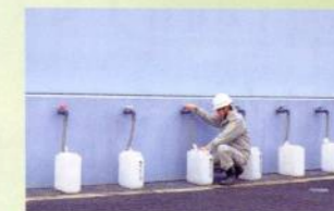
拠点給水施設（池島配水場）