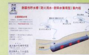
飲料水兼用耐震性貯水槽（総合庁舎内）