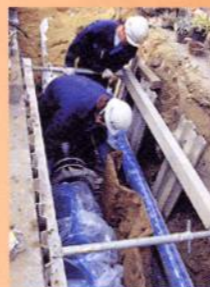
水道管布設替え工事