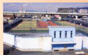
水走配水場上部利用（テニスコート）