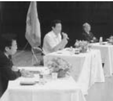
それぞれの立場から貴重な意見を話された三氏。(写真左から松見市長、中田横浜市長、塩川正十郎氏)