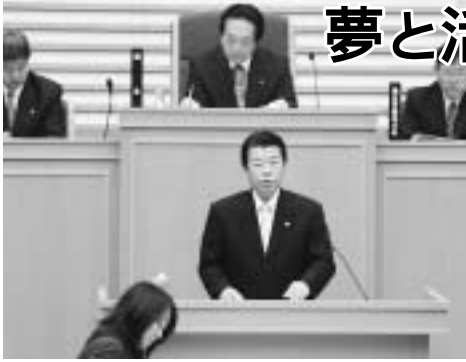
第1回定例会で市政運営方針を表明する松見市長