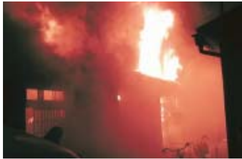
ちょっとした油断で火災は発生します

例五、新築住宅については平成18年6月から、既存住宅については平成23年5月31日までに設置が必要です。 住宅用火災警報器は電気店やホームセンターなどで