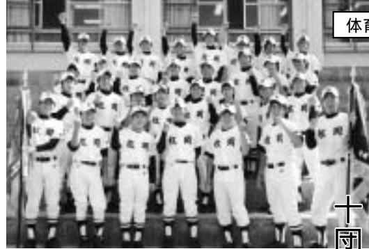
第59回大阪中学校総合体育大会準硬式野球の部で優勝した枚岡中学校野球部のみなさん