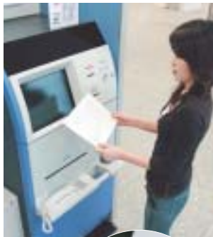
カードで手軽に発行ができます