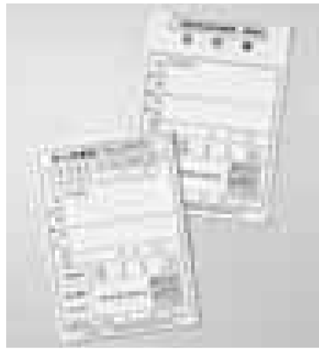
65歳以上で対象となる方

一部負担金相当額等一部助成証明書と老人医療証は、8月1日から新しくなっています。