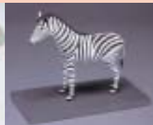
これが紙かと驚かされる繊細な作品の数々

別添入場料が必要 申込方法 往復ハガキに行事名、住所、親子の氏名(ふりがなも)、電話番号を書いて、5月10日(※消印有効までに郵送)汚れてもよい服装で、はさみと定規を持参。 月曜日は休館 内容 ペーパークラフト、紙素材の現代美術作品など 入場料 三百円 中学生以下、65歳以上の方、障害者手帳などを持つ方は無料