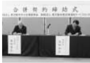
「中小企業のまち東大阪」ならではの団体としてこれまで以上に中小企業とそこで働く人々を総合的に支援し、市内経済の活性化と市民サービスの向上に積極的に取り組んでいきます。