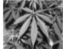
自生している大麻を見つけたら連絡を

毎年5月1日から6月30日までは「不正大麻・けし撲滅運動」期間です。大麻は、都道府県知事の免許を受けた大麻取扱者でなければ栽培することはできません。また、けしには植えてよいけし(ひなけし、おこげし、アイスランドポピーなど)と植えてはいけないけし(ソムニフェルム種、セティゲルム種、ハカマオニゲシ)があります。これらのけしは、観賞用としても栽培することはできません。不正に大麻・けしを栽培するのは