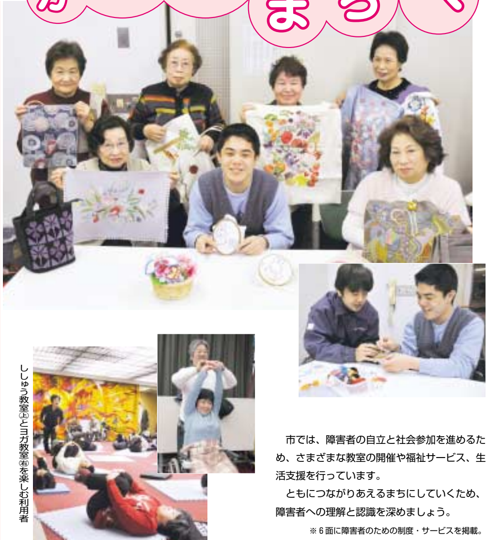
ししゅう教室(上)3B教室(下)を楽しく利用

※障害者スポーツ以外は高井田障害者センターで行います。申込方法 3月18日(金)までに電話で ■申込み・問合せ先 高井田障害者センター 06(6789)0131、FAX06(6789)2870