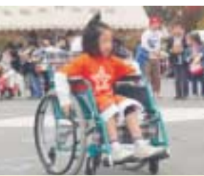
障害のある人とない人が交流し、障害について理解と認識を深めてもらうため、昨年11月に東大阪アリーナと八戸の里公園で「ふれあいのつどい」を開催しました

■申込み・問合せ先 【身体、知的障害のある方】 ▷東・中・西福祉事務所福祉係 東=072(988)6617、FAX072(988)6620 中=072(960)9275、FAX072(964)7110 西=06(6784)7980、FAX06(6784)7677 【精神障害のある方】 ▷東・中・西保健センター 東=072(982)2603、FAX072(986)2135 中=072(965)6411、FAX072(966)6527 西=06(6788)0085、FAX06(6788)2916 ▷健康づくり課 072(960)3802、FAX072(960)3809 【身体、知的、精神障害のある方】 ▷障害者支援室 06(4309)3184、FAX06(4309)3815