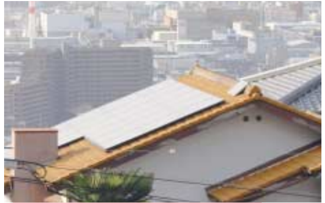
太陽光発電設備を設置する住宅が増えています

※申請書は環境企画課で配布。市ホームページからダウンロードもできます。郵送希望の方は住所、氏名を書き、200円分の切手を貼った返信用封筒(角2)を同封して、請求してください。