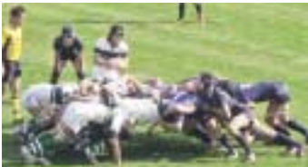
第90回全国高校ラグビー大会でスクラムを組む高校生たち

■問合せ先 ラグビーワールドカップ誘致室 06(4309) 3020、PR06 (4309) 3847