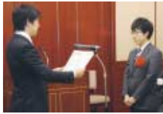
橋下知事から表彰を受ける 井山裕太さん

このほど、本市出身で一昨年開幕の名人位史上最年少で獲得した井山裕太さんが「平成22年度大阪文化賞」に選ばれ、大阪府公館で贈呈式が行われました。この表彰は、関西の棋士が名人になるのは初の快