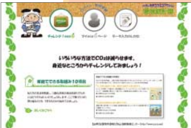
Web版環境家計簿で削減率をチェック

「Web版環境家計簿」インターネットでも環境家計簿に取り組みることができます(写真)。 Web版なら、参加者内のランキングや自分の削減率のグラフも表示され、削減率が簡単にわかります。企業・団体用もあるので、職場や団体の参加もできます。市ホームページにWeb版環境家計簿がありますので、ぜひ取り組んでください。