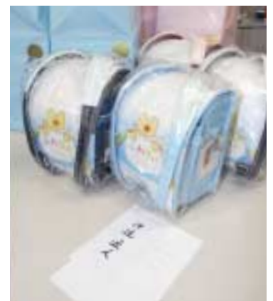
届けられたランドセルと手紙

この厚意に対し野田市長は「東大阪市福祉施設を介して、市内の児童養護施設の子どもたちにお届けしましたので、ご報告とあわせお礼申し上げます。誠にありがとうございました。」と話していました。