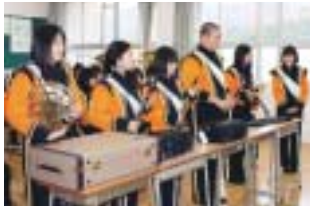
寄贈された楽器を持つ日新高校吹奏楽部の生徒たち

30周年を迎えたことを記念して行われたものです。全国大会などでも活躍する日新高校吹奏楽部は、1月に開催された教育フォーラムのオープニングセレモニーで寄贈された楽器を初披露。生徒たちは「天事にします」と話していました。