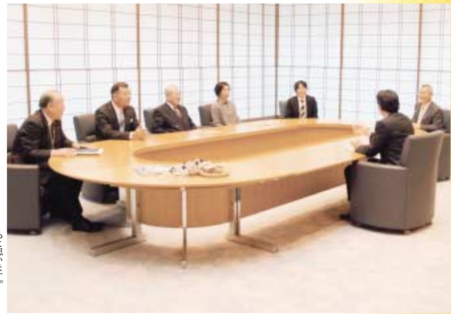
(市民美術センターで)

稲田桃が咲き誇るまち 野田市長が10年後にはありとあらゆることに植えられ、春先にはピンクの花が咲き誇るまちを、と考えています。