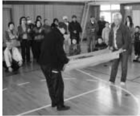
自主防災会による防災訓練

災害が発生したとき、被害を最小限に... 協力が不可欠です。... 市では、1月15日から21日までの「防... 災とボランティア週間」にあわせて講演... 会を開催します。ぜひこの機会に、災害... 時の活動の大切さについて、認識を深め... ませんか。