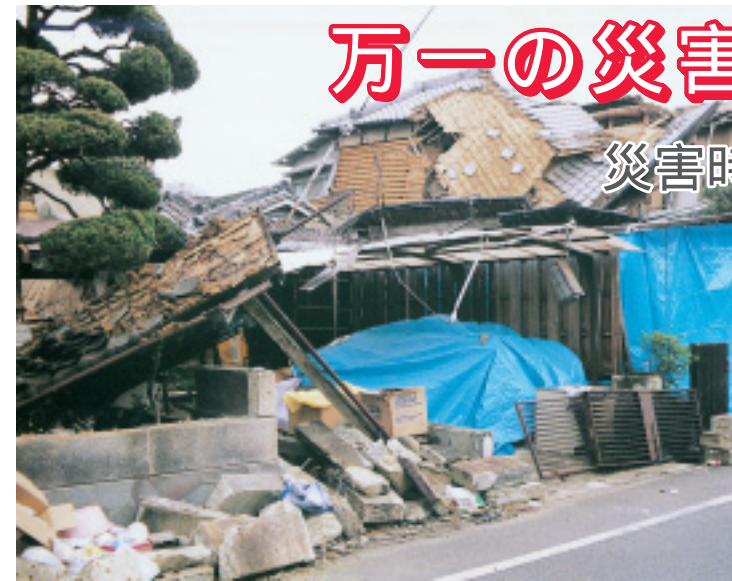
最大震度7を記録した阪神・淡路大震災

なぜ、登録が必要なのか 平成7年に発生した阪神・淡路大震災では、6,434人の尊い命が奪われました。その犠牲者の半数は援護などが必要な高齢者や障害者で、災害発生直後の救出活動が迅速に行われなかったこと、被災後の生活ケアが不十分であったことなどが大きな要因です。こうした過去の教訓から社会的弱者への支援対策がクローズアップされています。 しかし、近年都市化とともに隣近所の付き合いが希薄になる傾向があり、地域の中で高齢者や障害者がどこに住んでいるのか近隣の住民でさえ把握できていないのが現状です。「災害時要援護者登録制度」は、高齢者や障害者などが、災害時に地域の中で支援を受けることができるようにする制度です。