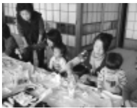
おやつを作る親子

また、市の保健師も参加しているので、子育ての相談や子どもの健康診断の日程などの情報も教えてもらうことが