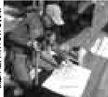
研究のために古文書を撮影

昔の地域の様子を知らない子どもたちに地域のことを知ってもらい、将来につなげていこうと活動しています。