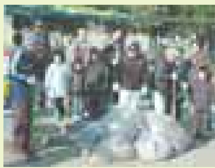
集まれば交流も深まります

楳根校区長田東自治会では住んでいるまちを明るくきれいにしようと公園とその周辺の美化運動に取り組んでいます。 「日ごろから地域の人が進んでごみを拾うなど、常にきれいな公園ですが、利用者をはじめ地域の人の交流を深める活動として、定期的に行われています。」 1月13日、自治会を中心に、子ども会や公園愛護会などが協力して、公園の一斉清掃が行われました。 この日は、昨日の雨で多くの枯れ葉が落ちていましたが、三分ほどの作業であつという間にきれいな公園になりました。 「いつもきれいな公園で遊べるの、うれしいです」と、日ごろ公園を利用している兄弟が照れながら答えくれました。また、地下鉄長田駅へも足を延ばして清掃に行った方々も「駅の掃除をする