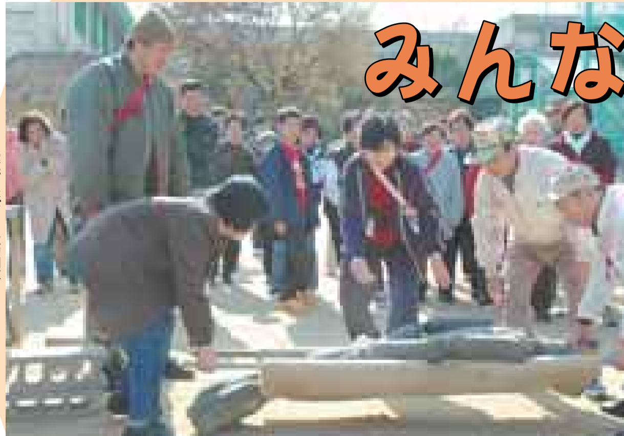
実践さながらの救助訓練

永和校区自主防災会による防災訓練が昨年1月18日、永和小学校で行われ、約二百人の住民が参加しました。