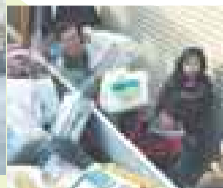
大きなトラックへの積み込みに一苦労