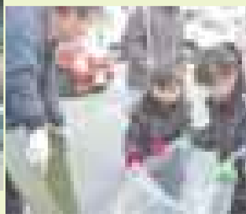
協力してごみを集めます