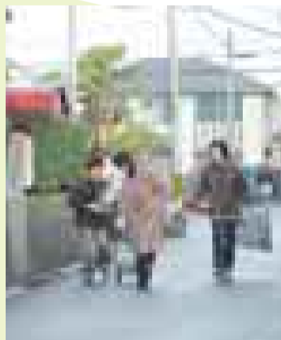
笑顔で遊ぶ子どもたち