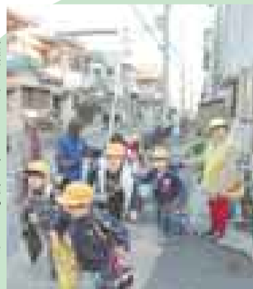
登校する子どもたちを毎日見守っています

さまざまな価値観をもった人が、それぞれのライフスタイルで生活する昨今、人と人とのつながりに無関心な人が増えています。人と人とのつながりを育み、住みよいまちづくりを進める自治協議会（自治会の総括団体）では、地域住民の和を大切に、これまで以上に積極的な「さわやか挨拶運動」を展開しています。 声かけは、防犯の効果があると言われていいます。安全・安心な地