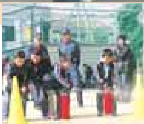
訓練用消火器を使っている初期消火訓練

まず、参加者は班に分かれて、それぞれの集合場所から永和小学校まで、なるべく安全な道を通り危険箇所などをチェックしながら歩きました。 同小学校に到着すると、さっそく応急処置訓練がスタート。消防員らの指導を受けながら、数人の参加者が実際にタミー人形を使い、心臓マッサージや人工呼吸、AEDの取付けなどを体験しました。 このあと、「災害用伝言ダイヤル」と昨年10月から気象庁がスタートさせた「緊急地震速報」の説明を受けました。 最後は、消火器による初期消火訓練と救助訓練を実施