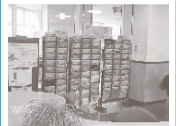
リーフレットコーナーでは、イコーラムの講座や他の女性センターの情報などを得ることができます。

だれもが性別にかかわらず、人権を尊重され、 個性と能力がいかされる社会をつくるための拠点となる施設です。