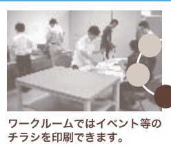
ワークルームではイベント等のチラシを印刷できます。

男女共同参画に関する講座、女性の就労支援や人材育成のための講座等を行うとともに、講演会、フォーラム、ビデオ上映会等を開催します。