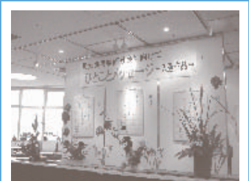
市民の作品が展示されたギャラリー。