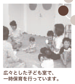
広々とした子ども室で、一時保育を行っています。

市民が交流したり情報交換する機会を設けています。 登録団体へはメールボックスも提供しています。