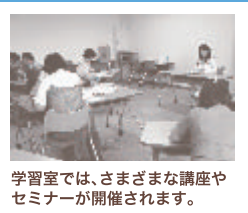
学習室では、さまざまな講座やセミナーが開催されます。

男女共同参画に関する図書やビデオ等を収集し、閲覧・貸出をしています。 行事案内等のリーフレットも発行しています。