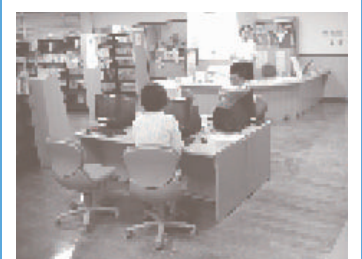
情報資料室では、男女共同参画関連図書や絵本の貸出のほか、ビデオを観ることもできます。

近鉄若江岩田駅前の市街地再開発ビル(希来里)施設棟6階にあります。 ホール、ギャラリー、情報資料室、研修室、ワークルーム、子ども室などが設置され、 さまざまな事業を行っているほか、市民の自主的な活動を支援する場所です。 平日は午後9時半まで開いていますので仕事帰りに利用することもできます。 (休館：月曜・祝日・年末年始。日曜は午後6時まで)