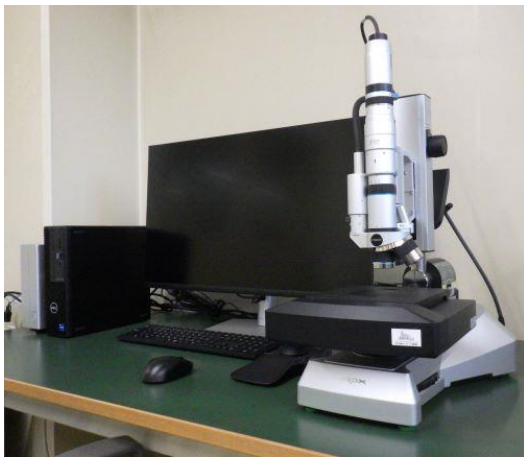
非接触表面性状測定装置

本装置により、① めっきや硬質皮膜コーティング部品の摩擦・摩耗特性、② 熱処理や表面処理した金型材の寿命、③ 潤滑油の潤滑性能、④ タッチパネルやプラスチック部品の耐擦傷性、⑤ 塗装皮膜の耐久性などの試験・評価等にご利用いただきます。