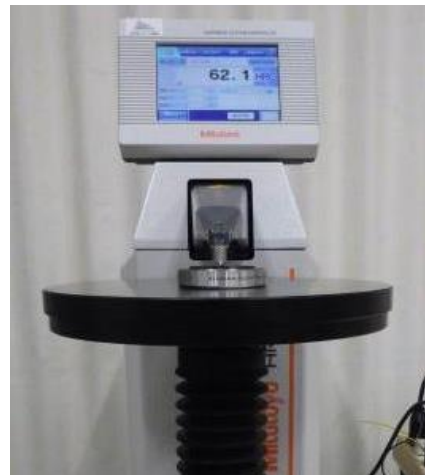
ロックウェル・ブリネル硬さ試験機