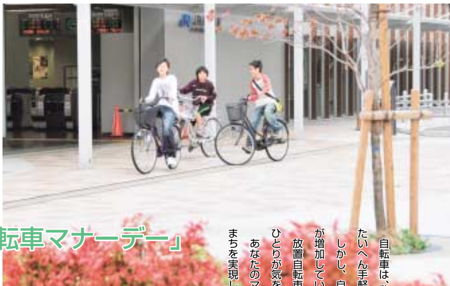
放置自転車のないきれいな駅前