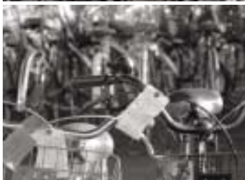
▶若江保管所には約3,500台の撤去した自転車が保管されています(写真上下) ▶道路に放置されている自転車(写真右上)