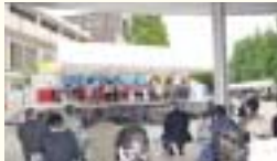
学生と市長の話を聞く 来場者(大阪商業大学)