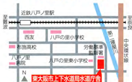
上下水道局水道庁舎位置図