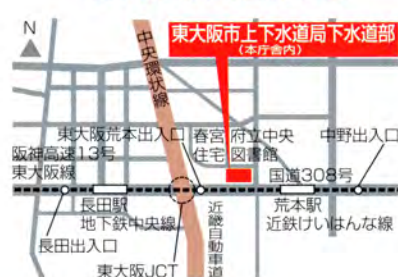
上下水道局下水道部位置図

〒578-0944 東大阪市若江西新町1丁目6番6号 TEL.06(6724)1221 HPアドレス http://www.suidou.city.higashiosaka.osaka.jp/ MAILアドレス suidosomu@city.higashiosaka.lg.jp