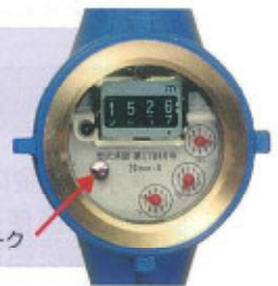
パイロットマーク