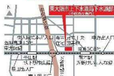
上下水道局下水道部位置図

〒578-0944 東大阪市右江西新町1丁目6番6号 TEL.06(6724)1221 HPアドレス http://www.city.higashiosaka.lg.jp/category/12-0-0-0.html MAILアドレス suidosomu@city.higashiosaka.lg.jp