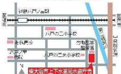
上下水道局水道庁舎位置図