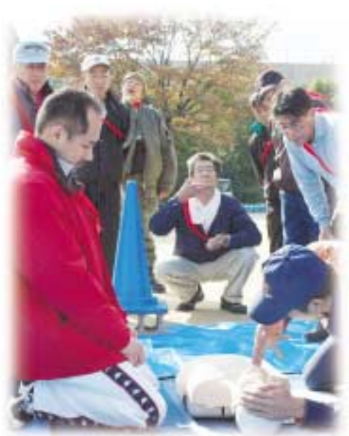
消防による救命講習

人のつながり、地域の力は減災につながります。平成7年1月17日、阪神・淡路大震災が発生したときも、たくさんの命が地域の人の力によって助けられました。1月15日から21日までは、「防災とボランティア週間」です。震災の被害を教訓にして、防災意識を高めましょう。