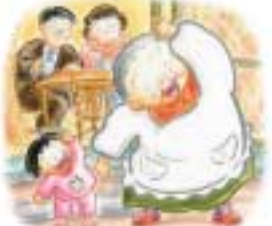
「あっちゃんおはよう」2008年

ご利用ください 市民美術センターの展示室など 利用期間 8月3日(火)～12月5日(日) (市主催行事などの期間を除く) 施設 第1・2・3展示室(和室) ※会議室のみの利用不可。 ※対象 美術、書道、工芸、文学、茶花道、手芸などの発表・展示会 申込方法 2月2日(火)～7日(日)午前10時～午後5時に直接 ※申込多数の場合は抽選。申込締切後に空き施設がある場合は、3月2日(火)から受付(申込先着順)。