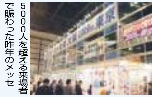
5000人を超える来場者で賑わった昨年のメッセ

【ビデオ・DVDライブラリー貸出】 中小企業人材育成センター(東大阪商工会議所内)では、人材育成、社員教育などのビデオ・DVDを貸出しています。