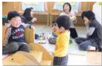
親も子も楽しい出会いがいっぱい

▽応募・問合せ先 〒577-8521 市役所子育て支援課 06(4309)3302、06(4309)3801、Eメール kosodatar@city.nigashiosaka.lg.jp