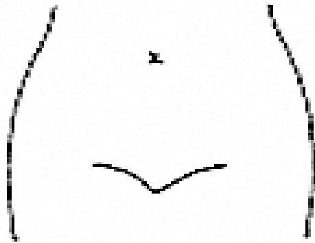
(ストマ及びびらんの部位等を図示)