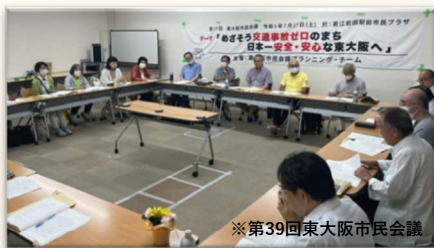
※第39回東大阪市民会議