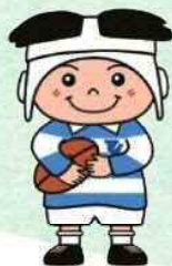
東大阪市マスコットキャラクター トライくん