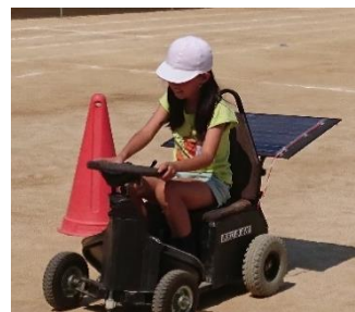
<ミニソーラーカー試乗>