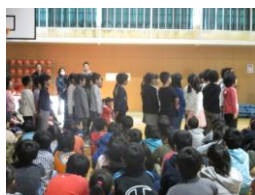
2 年 生