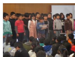
4 年 生