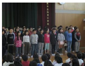
5 年 生 (集い集会)