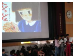
3 年 生