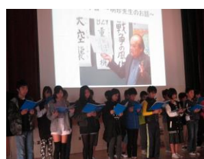
6 年 生