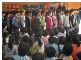
1 年 生

本校では、毎年11月に、「平和集会」と「国際理解集会」を隔年ごとに行い、それぞれの学びを発表しています。日曜参観の際には、図工室に学んだ内容を掲示しております。保護者の皆様、ご覧いただけただでしょうか？今後もどんな学習を展開していつけるのか楽しみです。