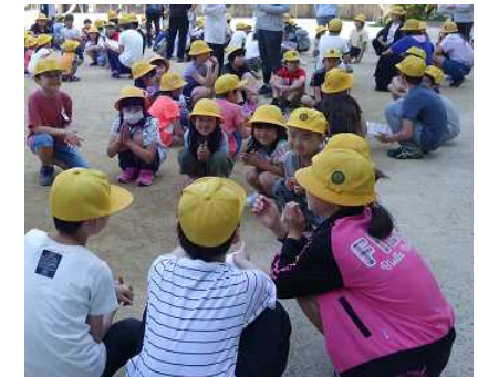
6年生を中心に「ふれあい班活動」が行われました (5月13日集会)