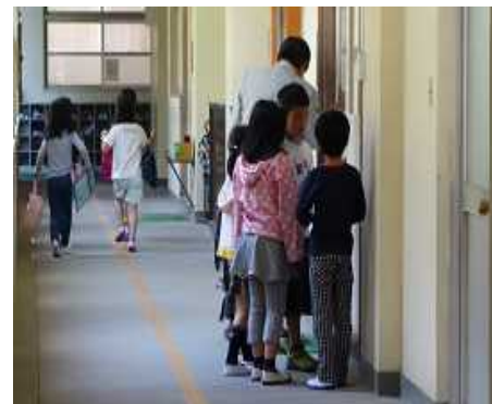
1, 2年生が協力して校内を探検しました (5月7日)