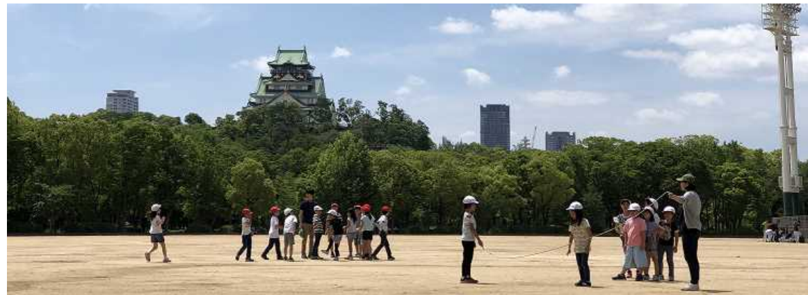
大阪城に見守られながら、鬼ごっこや大縄跳びをしました(5月21日3, 4年遠足)