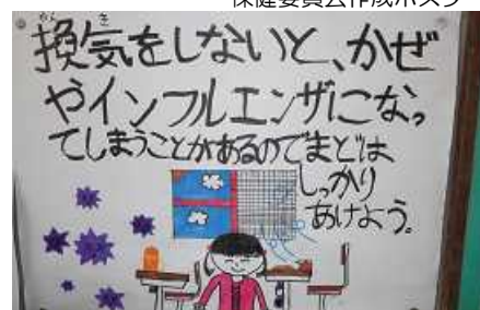
保健委員会作成ポスター