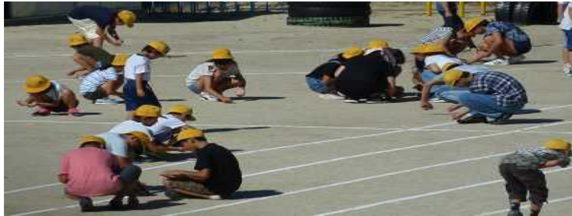
9月3日、2学期初の児童集会の後に運動場の石拾いをしました。