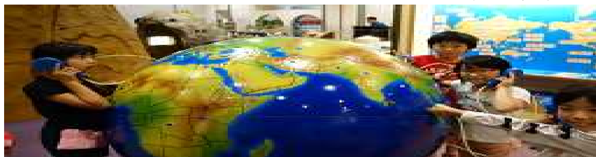
18日(金) 中学年の遠足が行われました。4年生と3年生が協力して班活動をしました