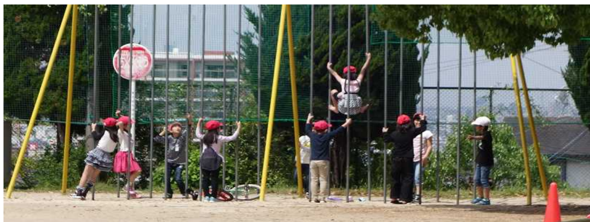
久しぶりのおひさまで。20分休み、子どもたちは元気に運動場に飛び出していました。5月9日撮影