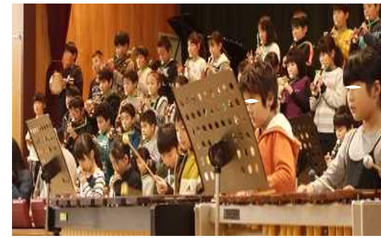
左上↑ 3年生 右上ノ 4年生 右→ 5年生