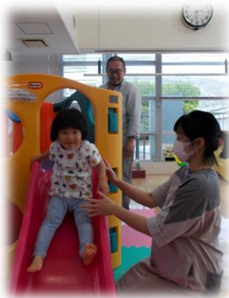
「パパママみててね」