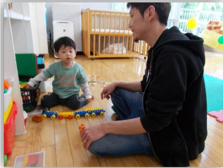
「ながーくつなげたよー♪」