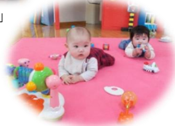
「うつぶせ上手でしょ」