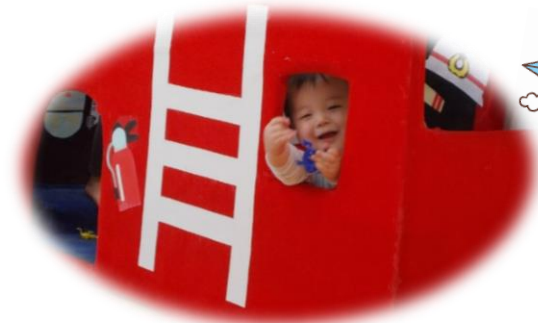
「初めてのバイバイはあさひっこで、できるようになったんだ！」